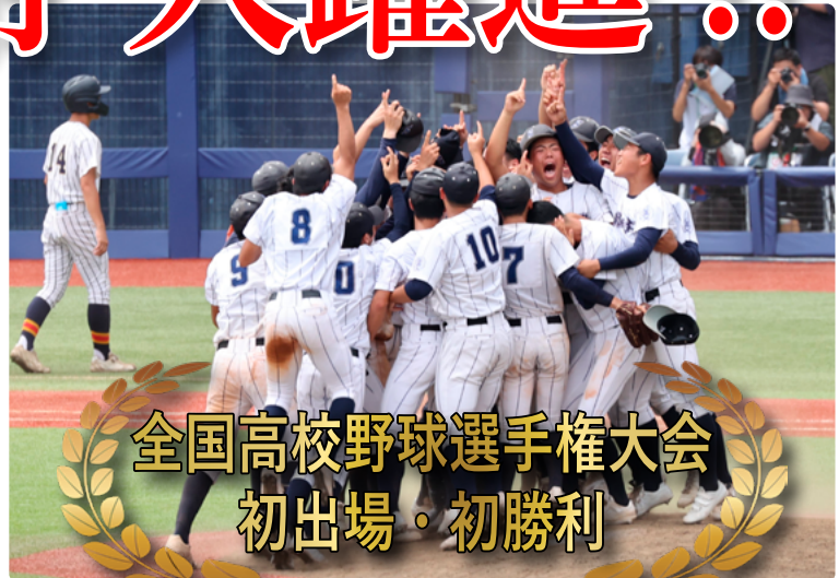
全国高校野球選手権大会 初出場・初勝利